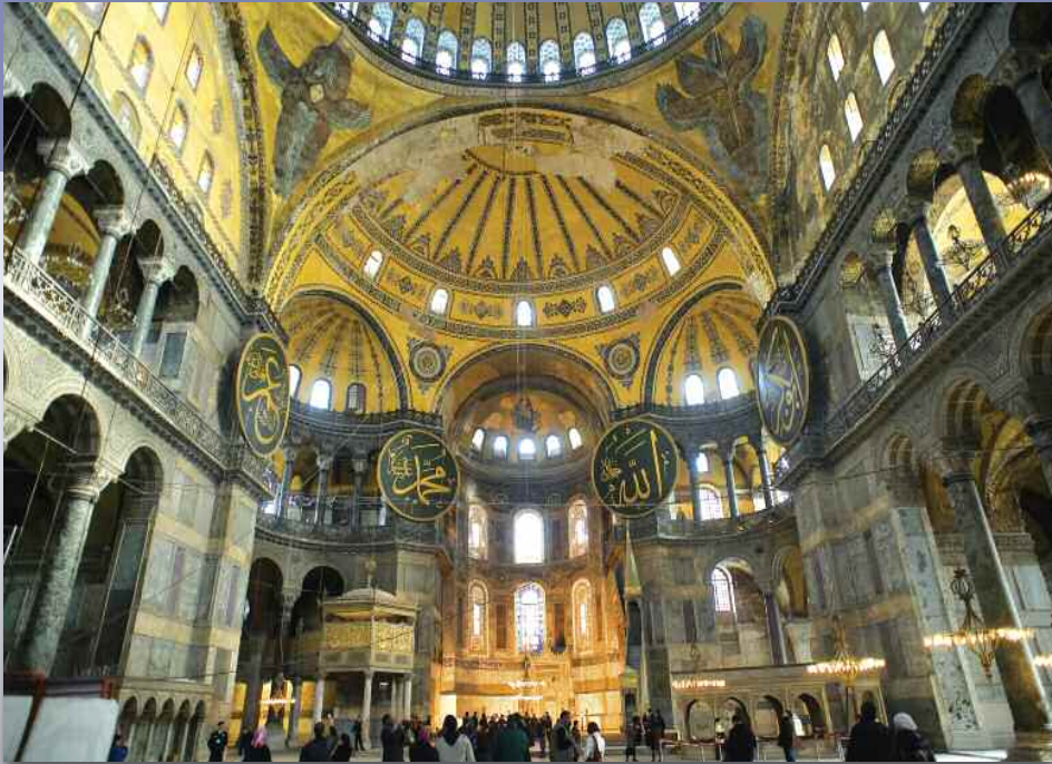
La Basilique Sainte-Sophie, Istanbul